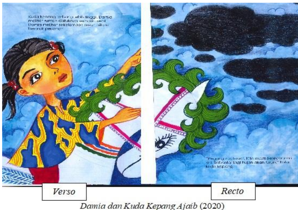
Rajah 4: Makna berbeza di antara muka surat verso dengan muka surat recto dalam buku cerita bergambar kanak-kanak bertajuk Damia dan Kuda Kepang Ajaib (2020)

Selain itu, interaksi antara muka surat verso dengan muka surat recto turut memberikan makna yang berbeza berdasarkan situasi cerita sebagaimana yang dikemukakan oleh Nikolajeva (2006), misalnya muka surat verso mengukuhkan situasi manakala muka surat recto memaparkan peristiwa yang mengganggu situasi tersebut. Sebagai contoh, dalam buku cerita bertajuk Damia dan Kuda Kepang Ajaib (2020) daripada genre cerita fantasi, gambar yang menunjukkan peristiwa Damia menaiki kuda keping ajaib dan berterbangan di udara jelas memaparkan makna yang berbeza di antara muka surat verso dengan muka surat recto seperti yang terdapat pada Rajah 4.