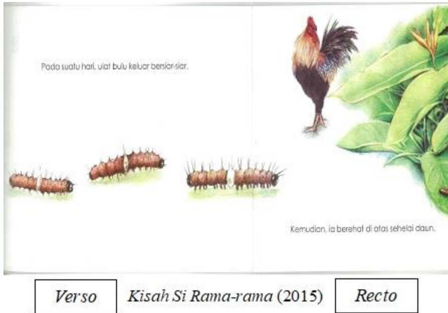
Rajah 2: Interaksi antara muka surat verso dengan muka surat recto dalam buku cerita bergambar kanak-kanak bertajuk Kisah Si Rama-rama (2015)