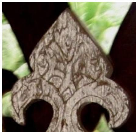
Foto 5: Motif Hayat Ağacı pada mimbar Masjid Tgk. Di Pucok, Pidie, Aceh [1620] Rakaman foto oleh pengkaji di lapangan dalam wilayah Aceh (24 April 2010)

Penyelidikan berasaskan kajian lapangan terhadap ragam hias mimbar sepanjang abad yang lalu telah mengenal pasti persamaan visual yang ketara dalam motif Hayat Ağacı. Berikut adalah antara contoh yang ditemui dan diperhatikan pada mimbar Asia Tenggara, seperti yang dipaparkan dalam Foto 5 dan Foto 6: