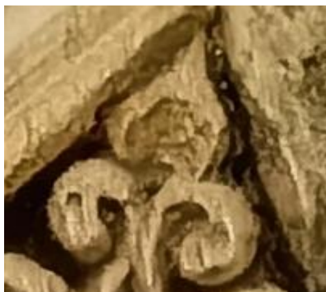
Foto 4: Motif Hayat Ağacı pada mimbar Bursa Ulu Camii, Bursa, Turki [1399]