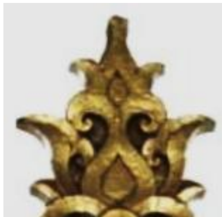
Foto 6: Motif Hayat Ağacı pada mimbar Masjid Losong Haji Mohd, Terengganu [1810] Rakaman foto oleh pengkaji di lapangan di Terengganu (08 Julai 2010)