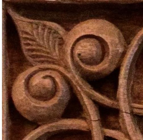
Foto. 2: Motif Hayat Ağacı Motif pada mimbar Divrigi Camii, Sivas, Turki [1288]

Berikut pula adalah dua lagi contoh motif Hayat Ağacı yang dapat dilihat pada mimbar masjid bersejarah iaitu di Aslanhane Camii (Foto 3) pada zaman Seljuk Anatolia dan di Bursa Ulu Camii (Foto 4) pada era empayar Turki Uthmaniyah yang dapat diperhatikan seperti berikut: