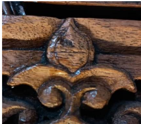
Foto 3: Motif Hayat Ağacı pada mimbar Aslanhane Camii, Ankara, Turki [1289/1290]

Berikut pula adalah dua lagi contoh motif Hayat Ağacı yang dapat dilihat pada mimbar masjid bersejarah iaitu di Aslanhane Camii (Foto 3) pada zaman Seljuk Anatolia dan di Bursa Ulu Camii (Foto 4) pada era empayar Turki Uthmaniyah yang dapat diperhatikan seperti berikut: