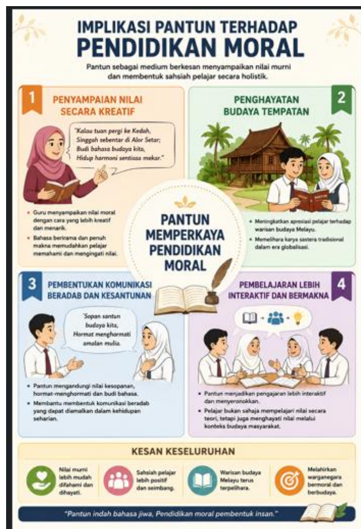
Rajah 2: Implikasi pantun terhadap Pendidikan Moral

Ketiga, pantun dapat membantu membentuk komunikasi beradab dan kesantunan bahasa dalam kalangan pelajar. Nilai kesopanan dan penghormatan yang terkandung dalam pantun boleh diaplikasikan dalam kehidupan harian. Keempat, pendekatan ini turut membantu guru mewujudkan suasana pembelajaran yang lebih interaktif dan bermakna. Pelajar bukan sahaja mempelajari nilai secara teori, malah dapat menghayati nilai melalui konteks budaya masyarakat.