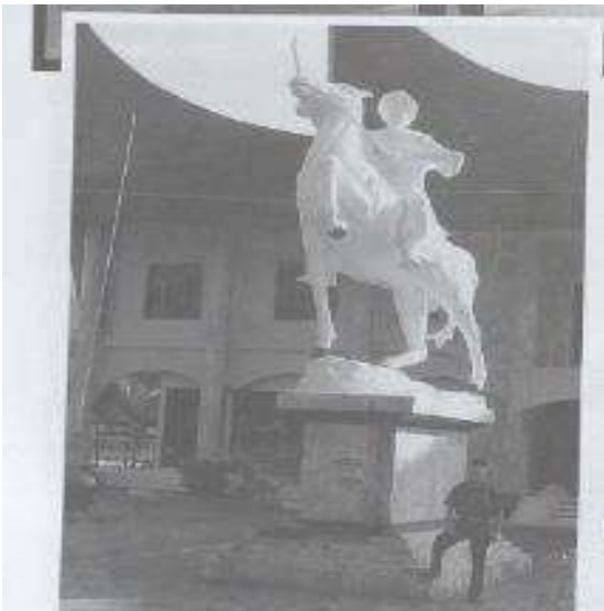
Rajah 1: Tugu Peringatan Tuanku Imam Bonjol (1772-1864) (Sumber: Bingkisan Sejarah Raub, Rao dan Pagaruyung: Pertaliannya dengan Raub dan Pahang , 2007)

Setelah dua puluh lima tahun 'Bonjol' berkembang, pasukan Belanda membuat gerakan ketenteraan dalam perang saudara ini. Pihak Belanda berjaya menguasai Pelabuhan Air Bangis. Akhirnya pada tahun 1831, Bonjol yang telah bersekutu dengan Aceh, menyerang Belanda semula. Kemudian, pihak Belanda mendapat bantuan dari Batavia dan melakukan serangan ke wilayah pengaruh Imam Bonjol. Pihak Belanda berjaya menawan satu persatu benteng paderi di Agam. Menurut buku Ensiklopedia Sejarah dan Kebudayaan Melayu (1999), pada bulan September 1832, Bonjol tewas. Imam Bonjol dan keluarganya melarikan diri. Pada 6 November 1864, Imam Bonjol meninggal dunia.