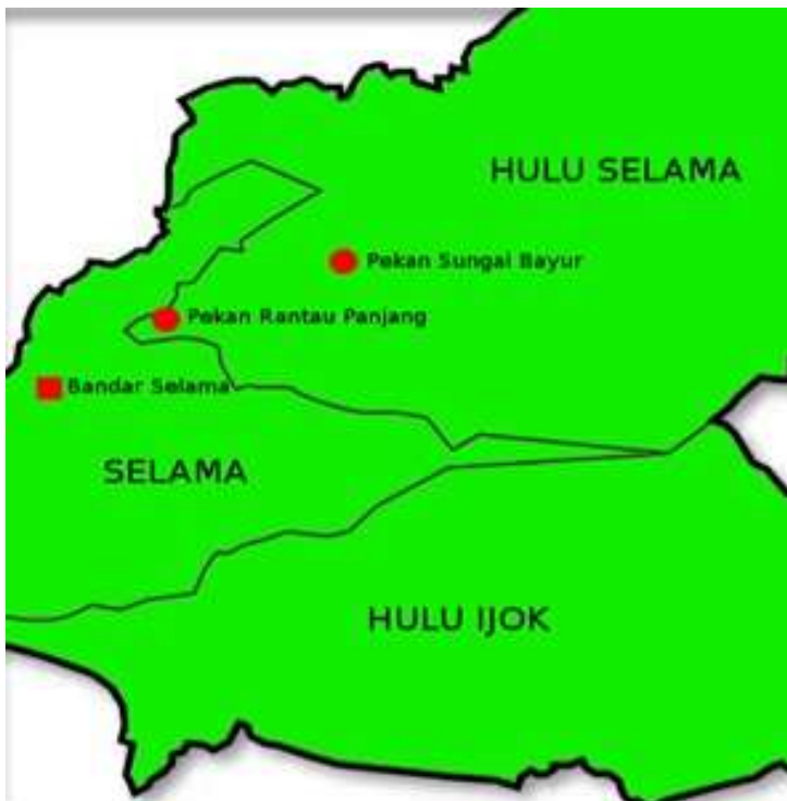
Rajah 2: Peta Daerah Selama